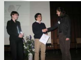
Bilder von der KogWis07, Saarbrücken